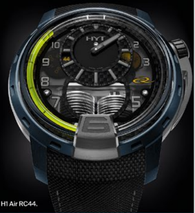
H1 Air RC44.