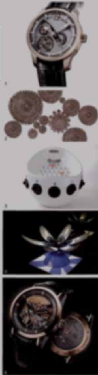
1. Grandet Forsey Tourbillon 24 Seconds Complication 24 x 41 x 48mm 自動上鍊 白金 售價: NT$ 14,800,000 - 2. H1 Dracula 21 x 42mm 42mm 售價: NT$ 8,800 - 3. Dream Machine No.3 28 x 38mm 28,800 - 4. H1 Dracula 21 x 42mm 42mm 售價: NT$ 8,800 - 5. Christophe Claret Maestro 28 x 38mm 售價: NT$ 7,700,000 -