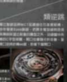
Harry Winston 鋼錶系列，限量2011，參考價NT$200起。

逆跳日期 + 陀飛輪 目前全球最複雜的機械錶之一，是擁有A.C. One 44 顆零件的逆跳日期 + 陀飛輪。這枚時鐘不僅具備逆跳日期功能，更搭載了罕見的陀飛輪機芯。逆跳日期功能可以讓時鐘在整點時自動跳過一整日，而陀飛輪則為時鐘提供了極高的時間精度。這兩種功能的結合，不僅展現了精湛的機械工藝，更賦予了時鐘獨特的藝術魅力。