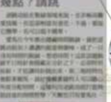
Harry Winston 鋼錶系列，限量2011，參考價NT$200起。