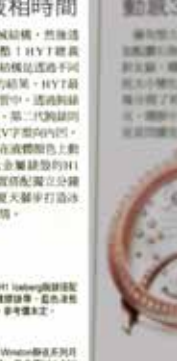
Harry Winston 鋼錶系列，限量2011，參考價NT$200起。