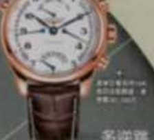
Harry Winston 鋼錶系列，限量2011，參考價NT$200起。