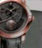
Harry Winston 鋼錶系列，限量2011，參考價NT$200起。