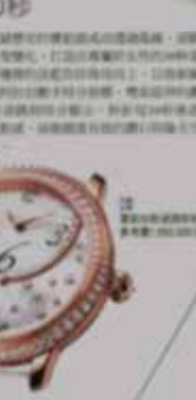
Harry Winston 鋼錶系列，限量2011，參考價NT$200起。