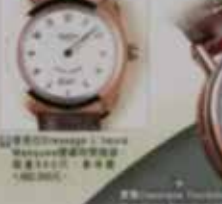
Harry Winston 鋼錶系列，限量2011，參考價NT$200起。