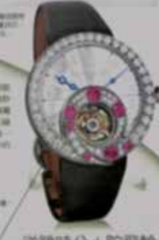
Harry Winston 鋼錶系列，限量2011，參考價NT$200起。