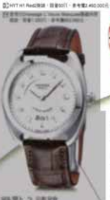
HYT Red2 鋼錶，限量2011，參考價NT$40,000起。

認識逆跳 扇形結構 逆跳時鐘的運作原理，簡單來說，就是當時間到達整點時，時鐘的指針會瞬間跳過一整小時，而不會像普通時鐘那樣一分一秒地移動。這種設計不僅具有極高的技術含量，更是一種獨特的藝術表現。逆跳時鐘的指針結構採用了扇形設計，這使得指針在跳動時能夠平滑過渡，避免產生突兀的跳動感。此外，逆跳時鐘的機芯結構也比普通時鐘更為複雜，這也為其增添了更多的收藏價值。