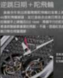
Harry Winston 鋼錶系列，限量2011，參考價NT$200起。