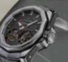
Harry Winston 鋼錶系列，限量2011，參考價NT$200起。