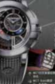
Harry Winston 鋼錶系列，限量2011，參考價NT$200起。