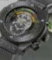
Harry Winston 鋼錶系列，限量2011，參考價NT$200起。