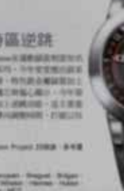
Harry Winston 鋼錶系列，限量2011，參考價NT$200起。